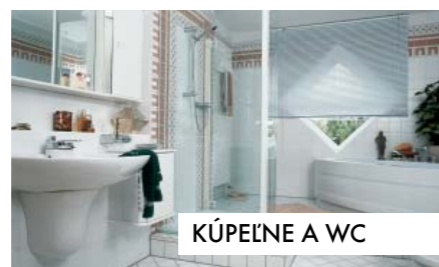
KÚPEĽNE A WC

Knauf Drystar je spoľahlivým riešením pre vlhké a mokré prostredie takmer pre všetky kategórie priestorov. Doska Knauf Drystar je vďaka inovatívnej kombinácii High Tech tkaniny a špeciálneho sadrového jadra vodoodpudivá a odolná voči plesniam.